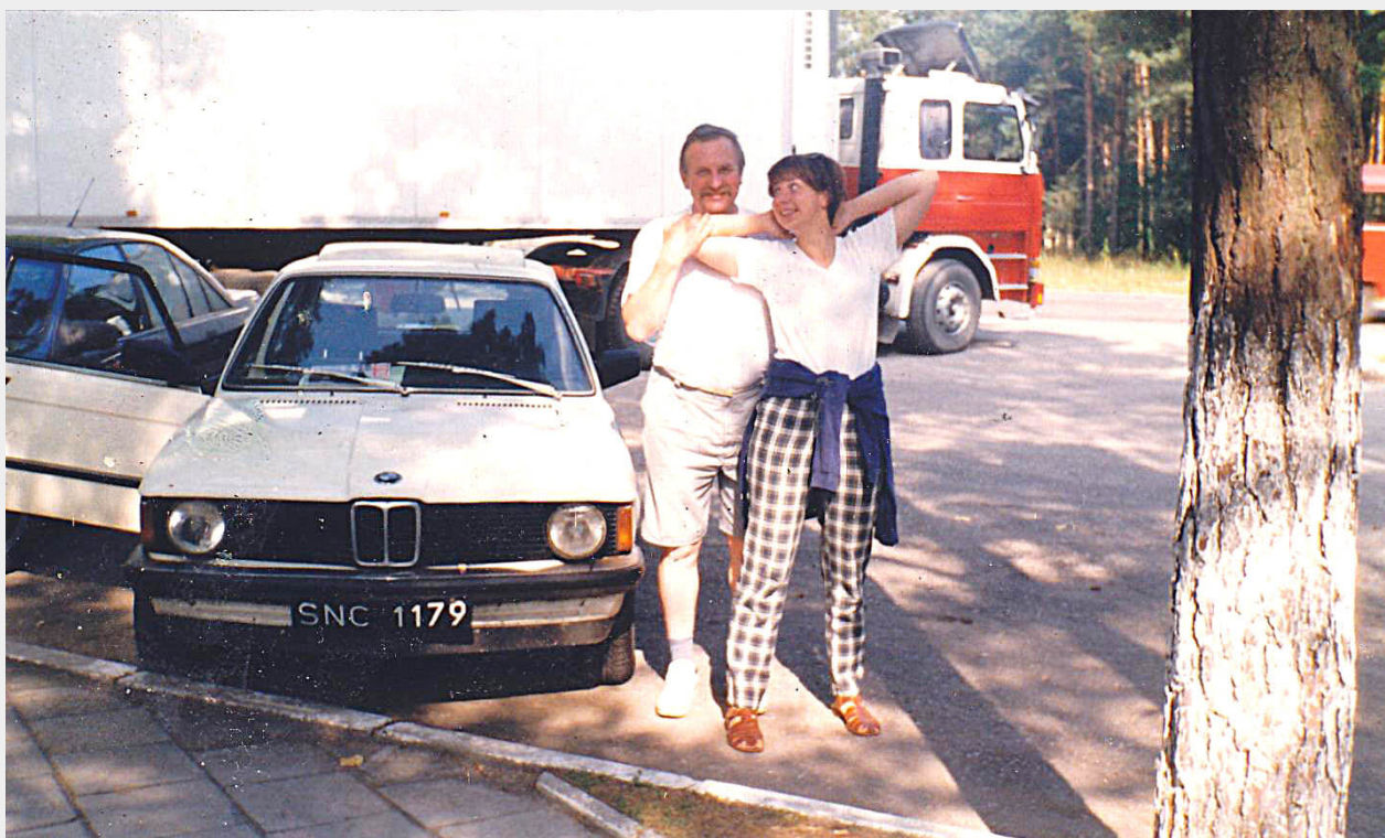
Zdjęcie odtworzone po 20 latach. W tym samym miejscu, w drodze do Białowieży.

- Po ojcu odziedziczyła miłość do jazdy autem. Na pewno pojedziemy do Białowieży. Będziemy prowadzić na zmianę. Był dumny z moich umiejętności kierowcy. Nie mogę się doczekać - w głosie słychać radość.