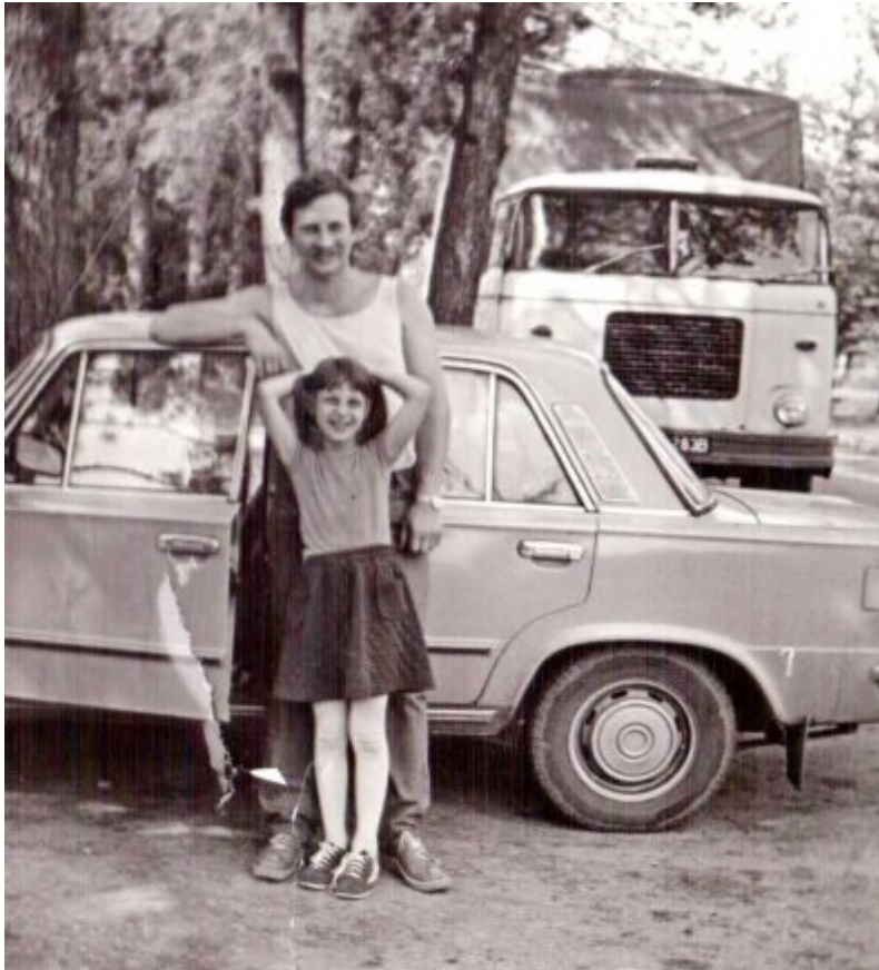
Zdjęcie z przeszłości, zrobione gdy pani Ewa miała 7 lat.

data aktualizacji: 2019.06.17 autor: Redakcja