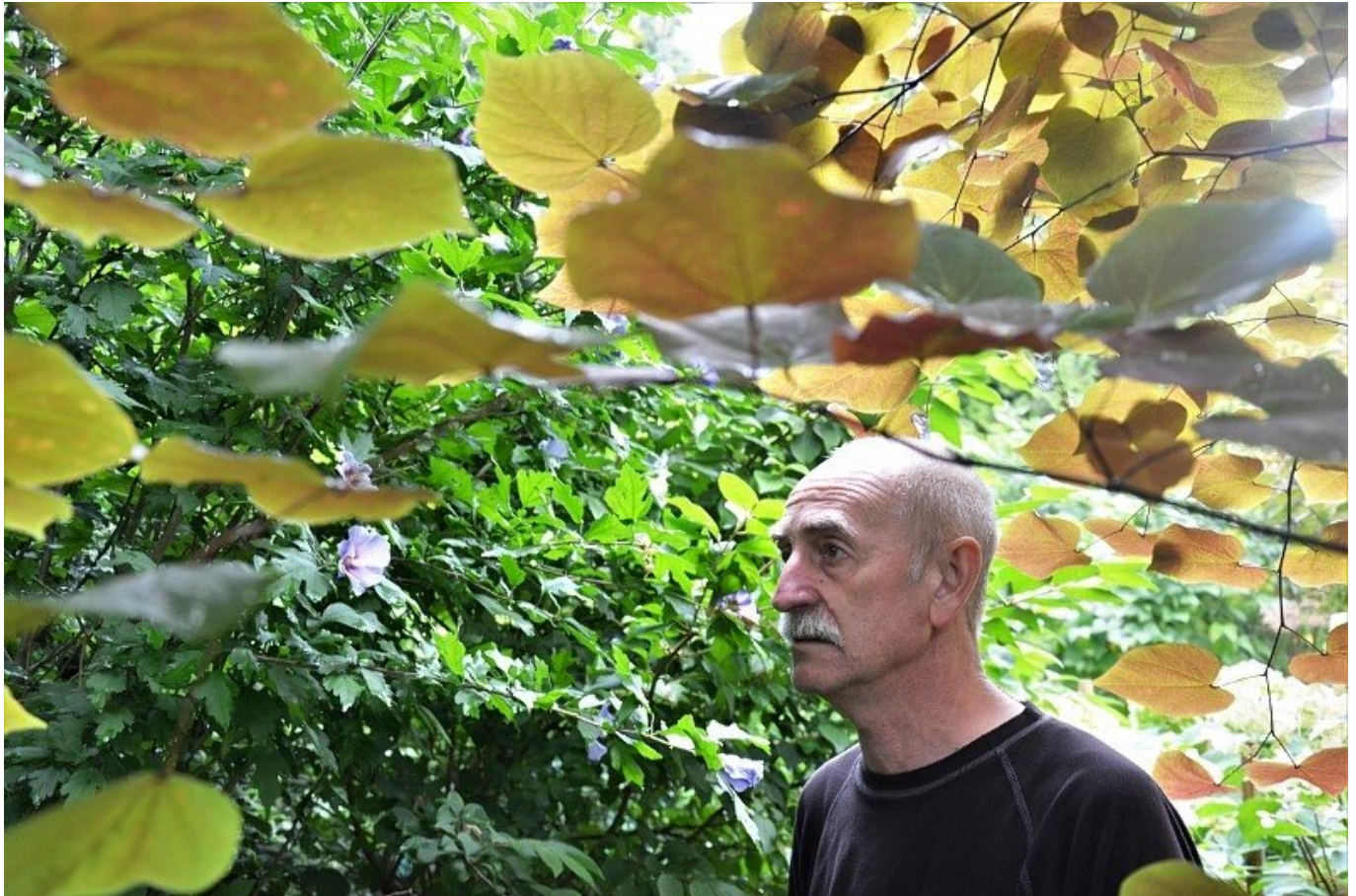
(fot. Włodzimierz Szczepański)

data aktualizacji: 2020.09.09 autor: Włodzimierz Szczepański