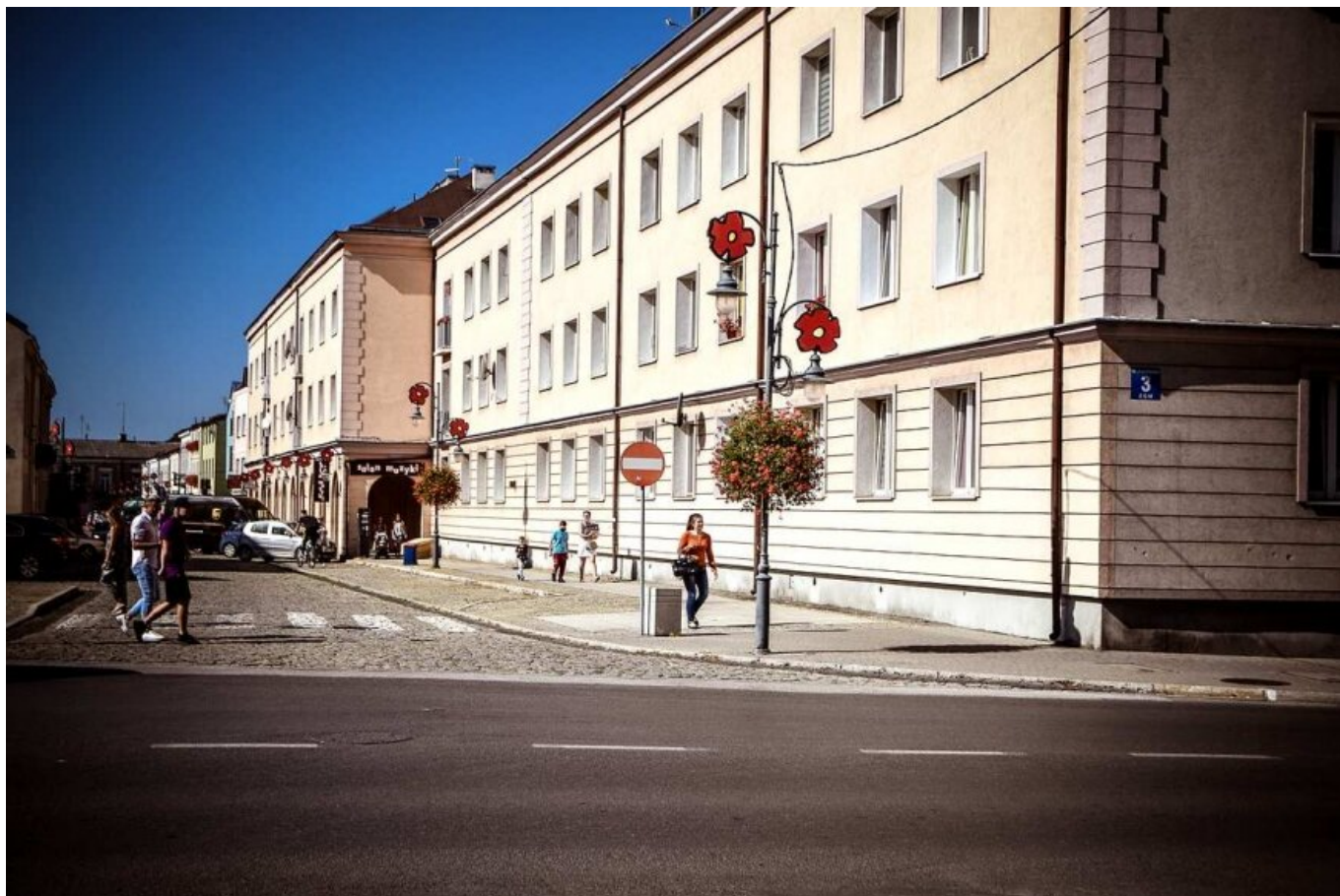
Ulica Żwirki w Skierniewicach.

data aktualizacji: 2020.09.14 autor: Sławomir Burzyński