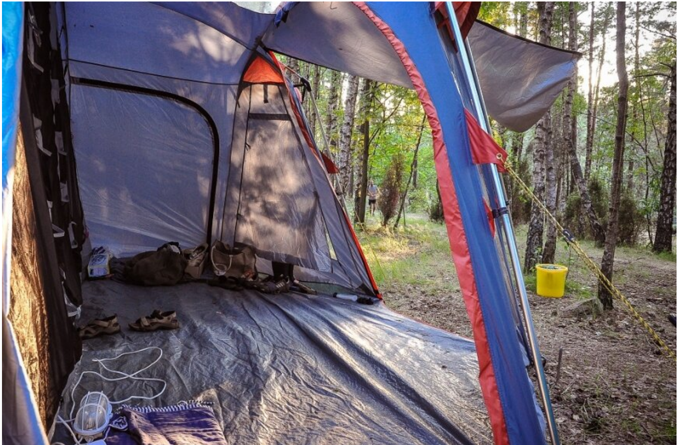
Hamaki są łatwe w użyciu, ale jeśli ktoś lubi mieć w lesie apartament...

data aktualizacji: 2021.04.30 autor: Sławomir Burzyński